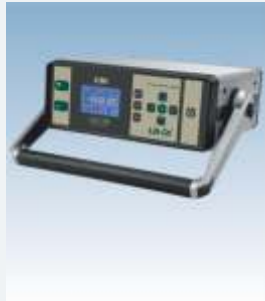
LR-Cal LCC 100