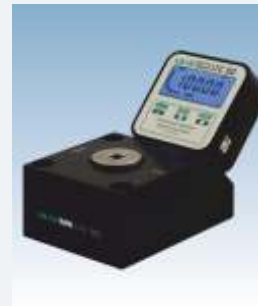
LR-Cal LFC 80