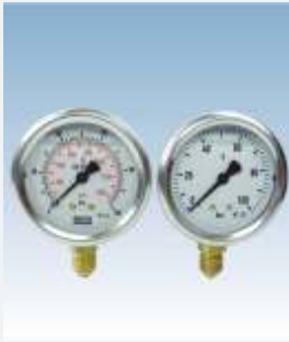
011.x.063. / 010.x.063.