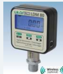
LR-Cal LDM 80