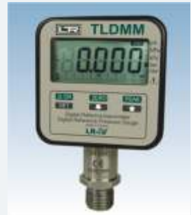
LR-Cal TLDMM 2.0