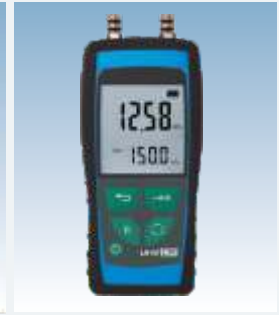
LR-Cal Serie 3000