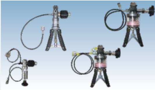
LR-Cal LPP 10 LR-Cal LPP 40 LR-Cal LPP 700 LR-Cal LPP 1000