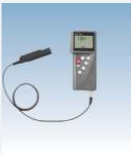
LR-Cal LRT 750