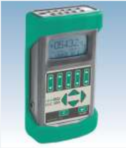
LR-Cal LTC 100