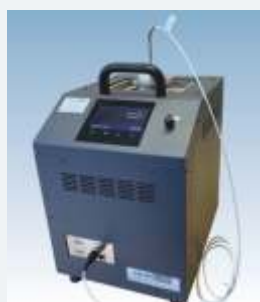
LR-Cal LTC 100/200-F