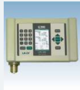
LR-Cal LPC 300