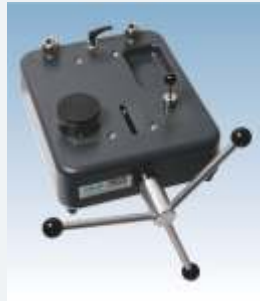
LR-Cal LSP 1200-H