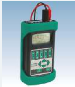
LR-Cal LLC 100